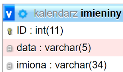
Ilustracja 1. Baza danych

Baza danych zawiera tabelę imieniny przedstawioną na ilustracji 1. Data zapisana jest w formacie mm-dd , np. data 7 listopada zapisana jest jako 11-07.