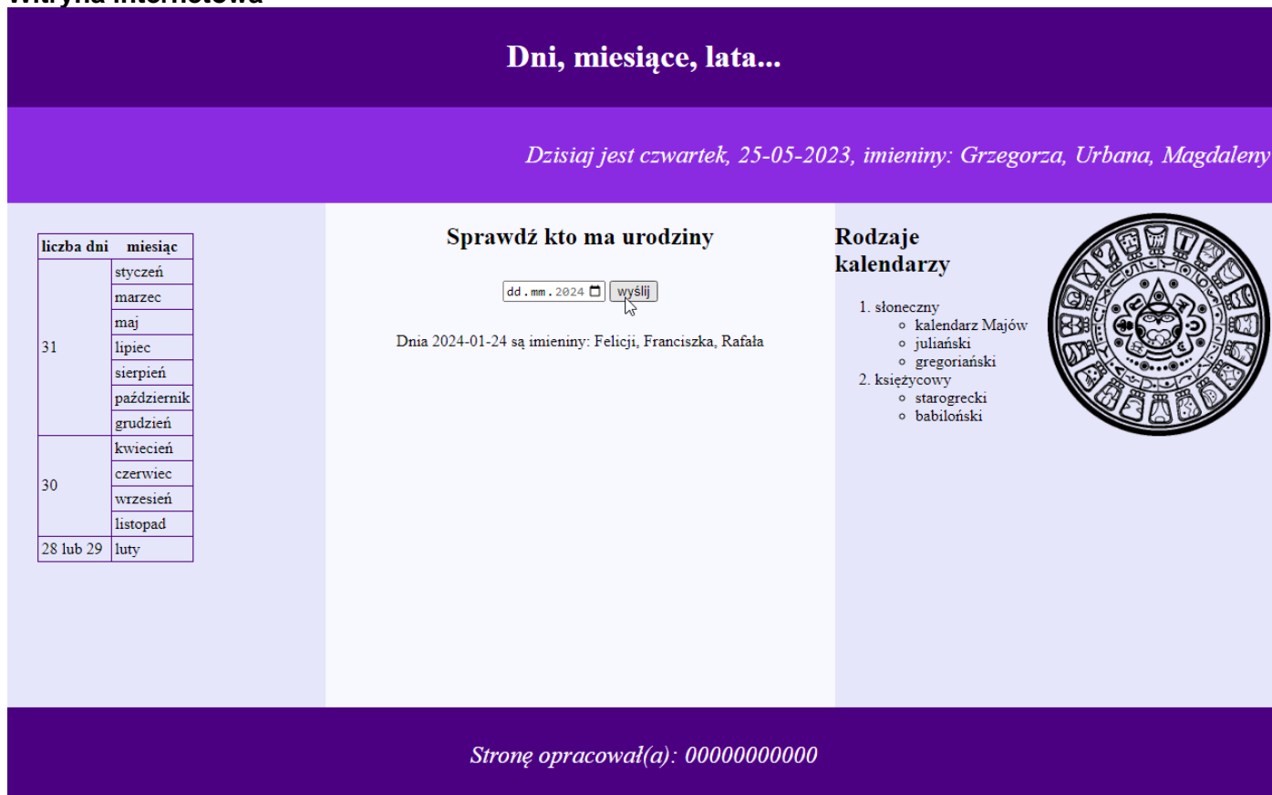
Ilustracja 2. Wygląd witryny internetowej w dniu 2023.05.25, wybrano w formularzu datę 2024.01.24